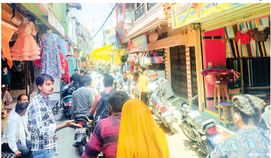
हरिभूमि न्यूज | सारंगपुर

शादी सीजन के चलते बाजार में खरीदारी करने वालों की भीड़ बढ़ी हुई है। वहीं बाजार में बेतरतीब खड़े किए जा रहे दोपहिया वाहन लोगों की परेशानी का कारण बने हुए हैं। क्योंकि शहर का बाजार पहले से ही अत्यधिक होने के साथ काफी संकरा है। दोपहिया वाहनों की बाजार में आवक बढ़ने से दुकानदार भी परेशान बने हुए हैं। इन सबके बावजूद प्रशासन द्वारा ध्यान नहीं दिया जा रहा है।