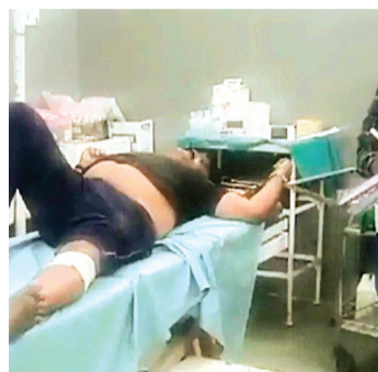
हरिभूमि न्यूज | राजगढ़