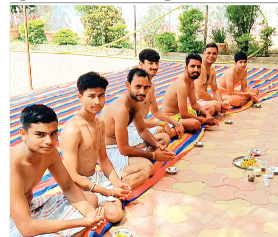
के साथ हनुमान जयन्ति मनाई जाएगी। रविवार को मंदिर परिसर में पंडित द्वारा यजमानों का शुद्धिकरण कराया गया।